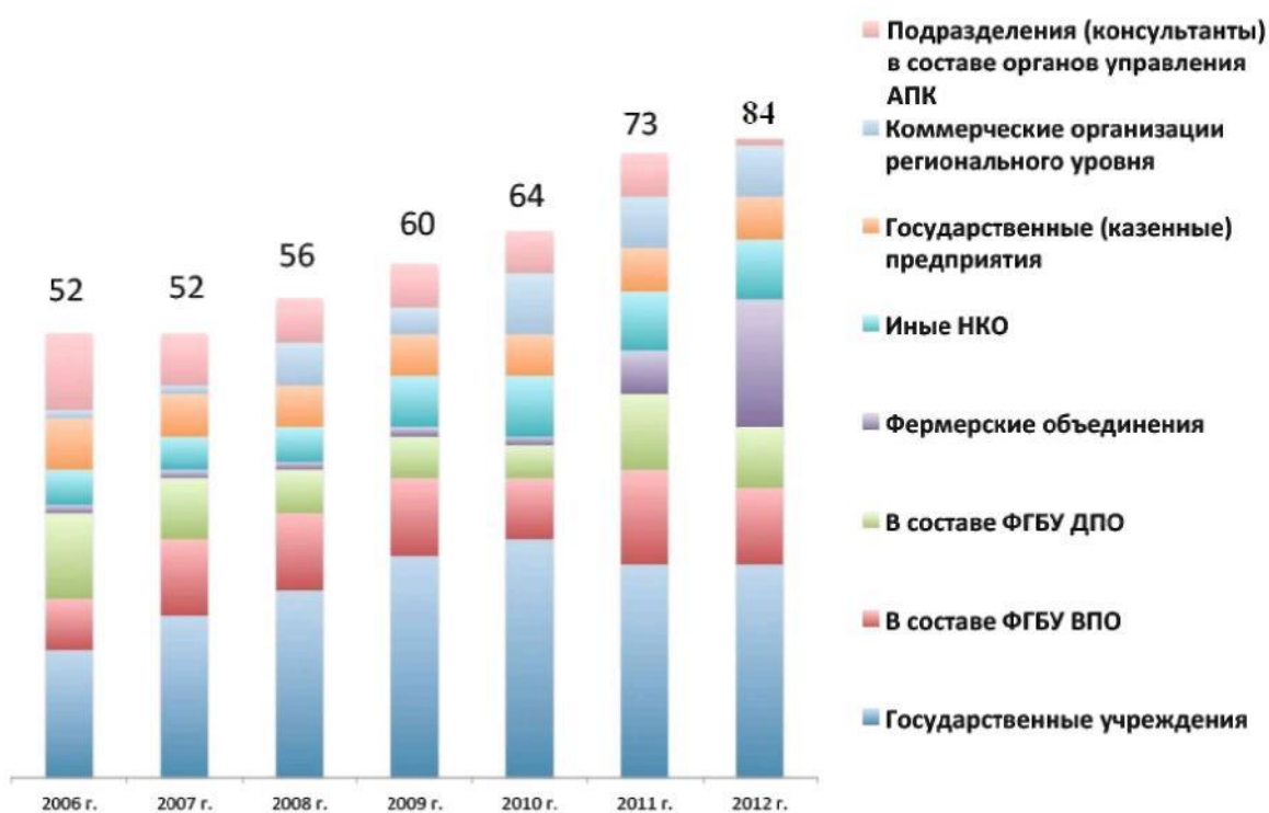
Рис.3. Кількісний і якісний склад організацій сільськогосподарського консультування за період з 2006 по 2012 рр..

Кількісний і якісний склад організацій сільськогосподарського консультування на кінець 2012 року представлений на рис.3.